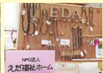
▲人気のネックレス等は、オープン粘土で心を込めて作っています。