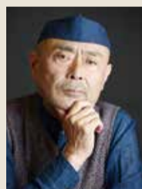
伊武雅刀さん (俳優)

私たち認定委員は、「おいしい」と自信を持って言える、青葉区らしいお店を選定しました。 今回認定した20店舗を加えた38店舗は、私たち認定委員のグループが、区民の代表として選んだということではなく、自分たちの納得できる「おいしい」お店を区民公募の店舗の中から選んだものです。 ですから、これを機会に区民の皆さまは、ぜひ、それぞれの青葉ブランドを考えてください。 そして、おいしいお店が身近にあることに気づいていただき、青葉区に住んでいることに誇りを持っていただきたいと思います。 また、青葉区以外に住んでいる皆さまにも、選ばれたお店にぜひ行っていただき、青葉区の魅力を感じていただければ幸いです。