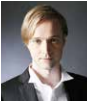
ビタリ・ユシュマノフ

欧州と日本、二つの文化の間で研ぎ澄まされた詩情 🕒5月18日(金) 11時30分開演 💰全席指定1,500円 🎵ピアノ:山田剛史