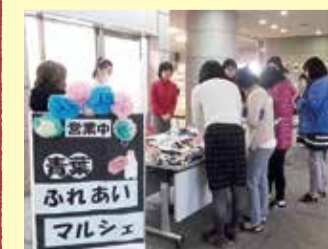
▲色とりどりの作品がたくさん並び「ふれあいマルシェ」

各作業班で時間をかけて作られた製品は、地域のイベントや同法人キッチンわがば、区役所での販売「ふれあいマルシェ」で購入できます。「ふれあいマルシェ」は、区役