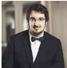
シャルル・リシャル=アムラン

繊細で包容力に満ちた音色は世界を魅了する。 🕒5月22日(火) 19時開演 💰全席指定5,000円