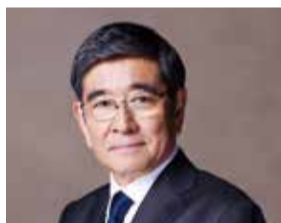
委員長 石坂浩二さん (俳優)

私たち認定委員は、「おいしい」と自信を持って言える、青葉区らしいお店を選定しました。 今回認定した20店舗を加えた38店舗は、私たち認定委員のグループが、区民の代表として選んだということではなく、自分たちの納得できる「おいしい」お店を区民公募の店舗の中から選んだものです。 ですから、これを機会に区民の皆さまは、ぜひ、それぞれの青葉ブランドを考えてください。 そして、おいしいお店が身近にあることに気づいていただき、青葉区に住んでいることに誇りを持っていただきたいと思います。 また、青葉区以外に住んでいる皆さまにも、選ばれたお店にぜひ行っていただき、青葉区の魅力を感じていただければ幸いです。