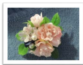
〈出来上がったブローチ〉