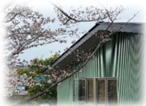
〈荏田コミュニティハウス〉