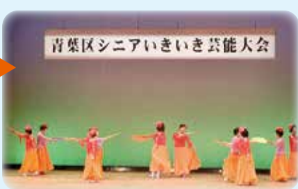
みんなで楽しくグラウンドゴルフ大会