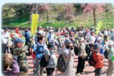
こどもの国でノルディックウォーキング

みんなで一緒に緑の中を歩くとさわやかな気持ちで体力づくりができます。初心者でも参加しやすいですよ。