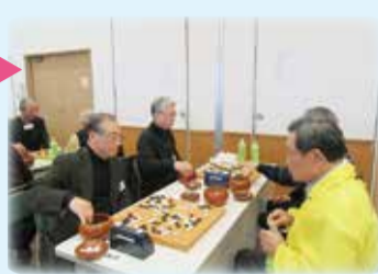
認知症予防にも! 囲碁・将棋大会