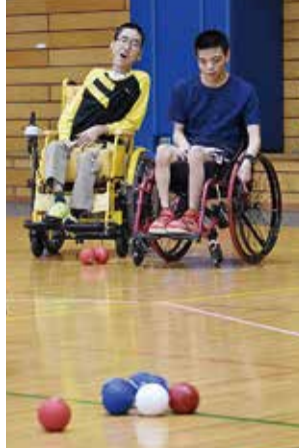
★赤、青どちらが近いかな

最近では、特別支援学校の授業や障害者支援施設のスポーツ教室などでも取り入れられています。