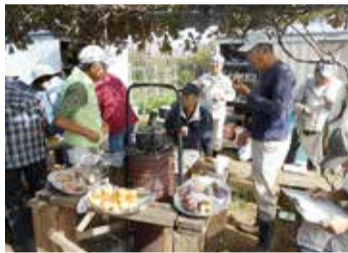
▲キウイの実がなる木の下でふかし芋を食べて談笑中