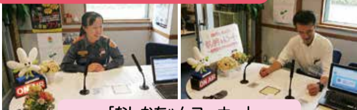
「なしちゃんコーナー」 ゲストが旬な話題やイベントを紹介しします。