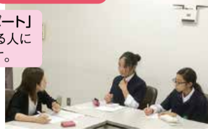
「サルスレポート」 区内で活躍する人に話をききます。