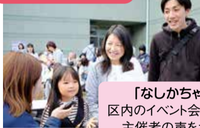
「なしちゃんが行く」 区内のイベント会場から参加者や主催者の声をお届けします。