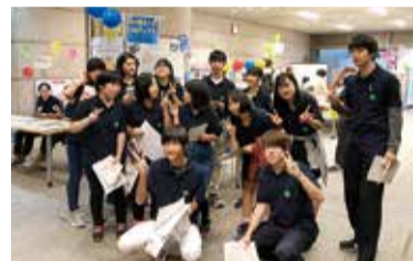
▲「Peeeya・おいでよ市ケ尾」チームで集合!

11月3日に開催された青葉区民まつりでは、区民活動支援センターのブースにて、ユースプロジェクト各グループが活動を行いました。活動を行ったグループは、「Peeeya・おいでよ市ケ尾」「チーム『まもる』」「Linkage」「老若男女」「ユース広報部」の5グループでした。