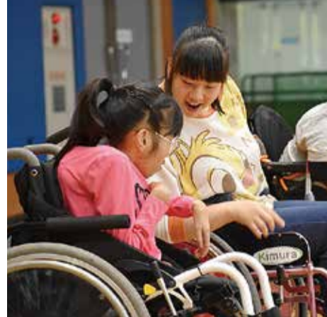
★つながりが生まれて思わず笑顔に