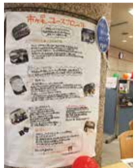
▲各チームの活動を掲示

「ユース広報部」は、区民まつりでの各チームの活動をまとめ、報告しました。また、ユースプロジェクトのほかに、同じ場所で発表を行った他団体の皆さんと交流をもつこともできました。