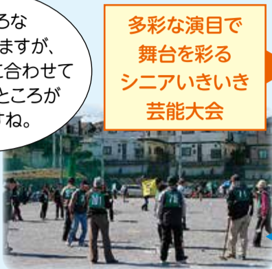
多彩な演目で舞台を彩るシニアいきいき芸能大会