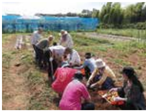
▲ジャガイモの収穫

農園では、障害者地域活動ホームや障害福祉事業所とボランティアの皆さんと一緒に農作業を行っています。活動を通じて、障害のある皆さんと地域社会との交流や、社会参加への活動支援につなげていくことを目的としています。安心・安全を大切に、年間を通じて60種類以上の品種を無農薬で栽培しています。農作業の合間の休憩には、採れたばかりのトマトやふかし芋などを外で試食します。開放感に満ちてとても気持ちよく、会話も弾み、和気あいあいとした雰囲気です。11月の芋煮会では、農園で採れた野菜を使った豚汁を食べたり、歌を歌ったり演奏を聴いたりして、ボランティアの皆さんと障害のある皆さんが交流を楽しんでいます。