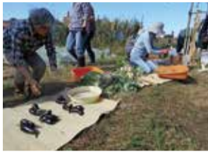
▲ナスやカブ、ミズナなどを収穫できました