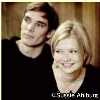
▲アリーナ・イブラギモバ(右) セドリック・ティベルギアン(左)