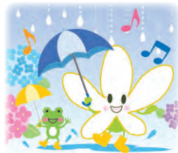
青葉区マスコット なしかちゃん