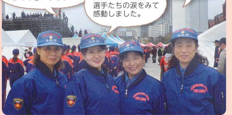
青葉区の女性消防団員