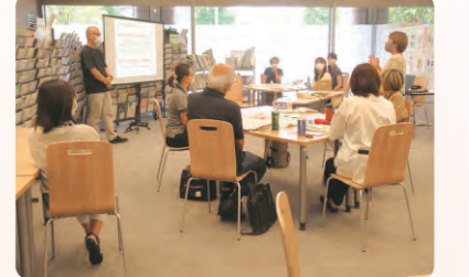
▲地域デビュー講座