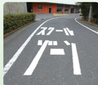
▲スクールゾーンの路面標示