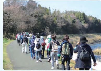
▲ウォーキングイベント