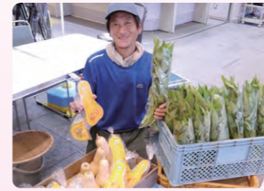
▲あおばマルシェ (毎月第3木曜、区役所で開催)