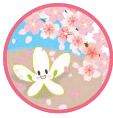
青葉区マスコット なしかちゃん