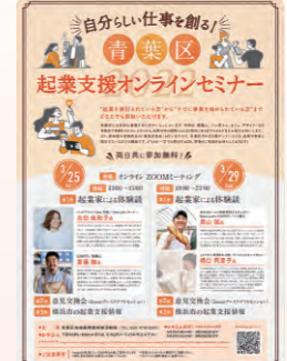
▲起業支援オンラインセミナー