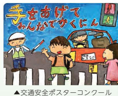
▲交通安全ポスターコンクール