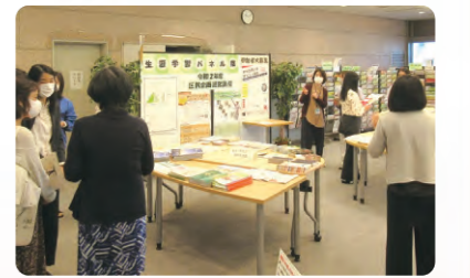
▲相談・コーディネート・交流会の実施

商店街連合会が実施する事業への補助や、商店街が主催するイベントを広報よこはま等でPRします。また、商店街を巡る「青葉区商店街お散歩まっぷ」を通じて、商店街を知ってもらおう機会を作ります。