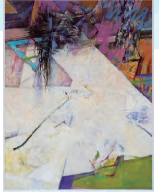
第6回 優秀賞「同じ空の下で」