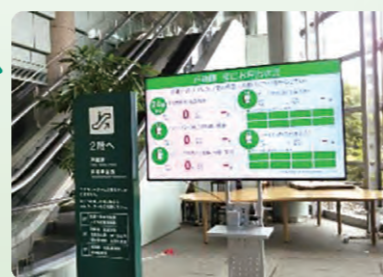
▲呼び出し案内モニターの設置