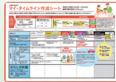
▲マイ・タイムライン作成シート