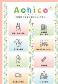
アプリのダウンロードはこちらから

未就学児を子育てしている世帯や妊婦の皆さんが、地域の子育てイベントや横浜市の子育て制度などの情報にアクセスしやすくすることで子育てを応援します。 その他、予防接種スケジュールや乳幼児健診情報のプッシュ通知などの便利機能もありますので、ぜひご利用ください。 地域の支援者の皆さんの取組もイベント情報として発信していきます。