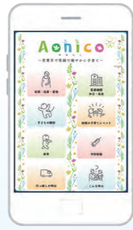
▲子育て情報発信アプリAonico