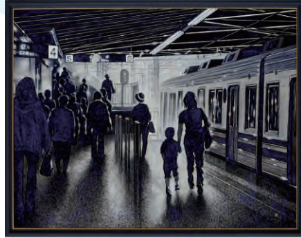
第6回 大賞「家路(自由が丘)」