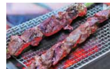
山形県高島町の牛串焼き