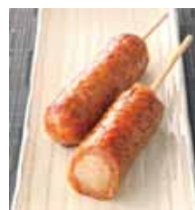
希望の環のぶたんぼ

趣向を凝らした模擬店の数々。他都市物産展では東北地方などのご当地グルメが味わえます!