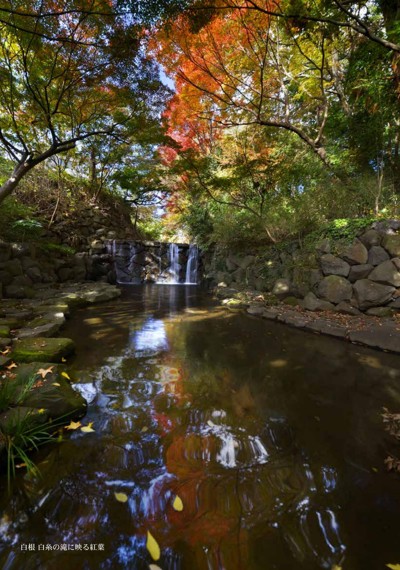
白根 白糸の滝に映る紅葉