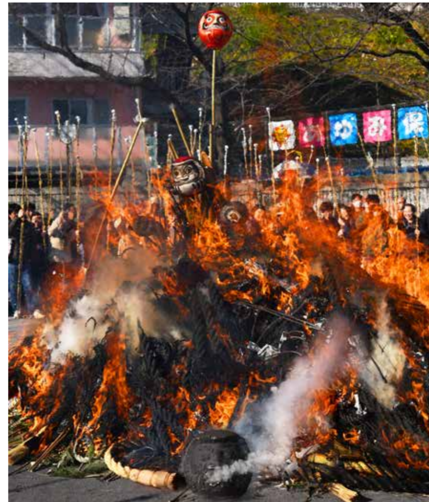
どんど焼き 鶴ヶ峰公園