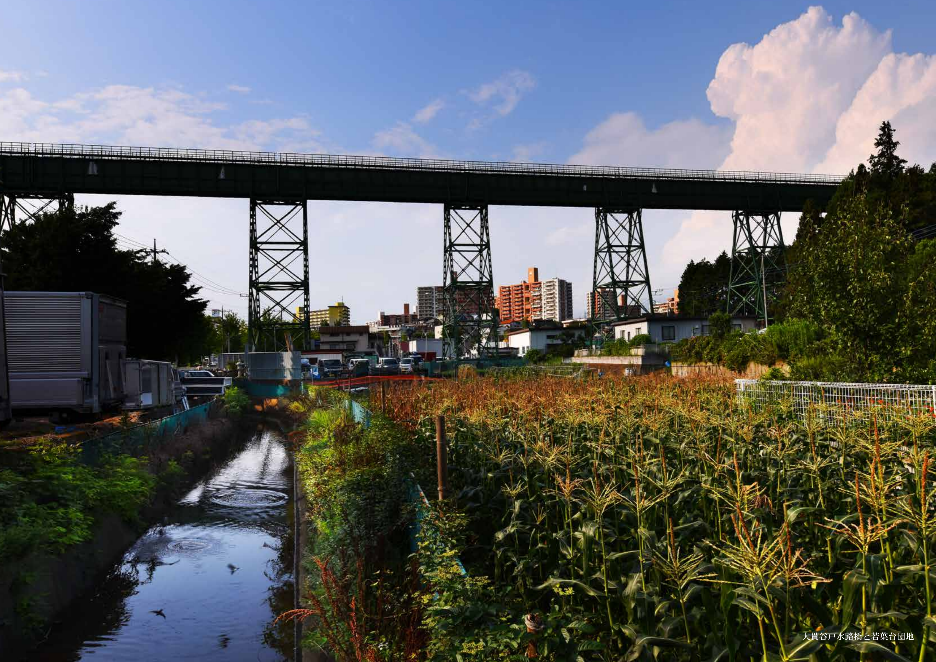
大貫谷戸水路橋と若葉台団地