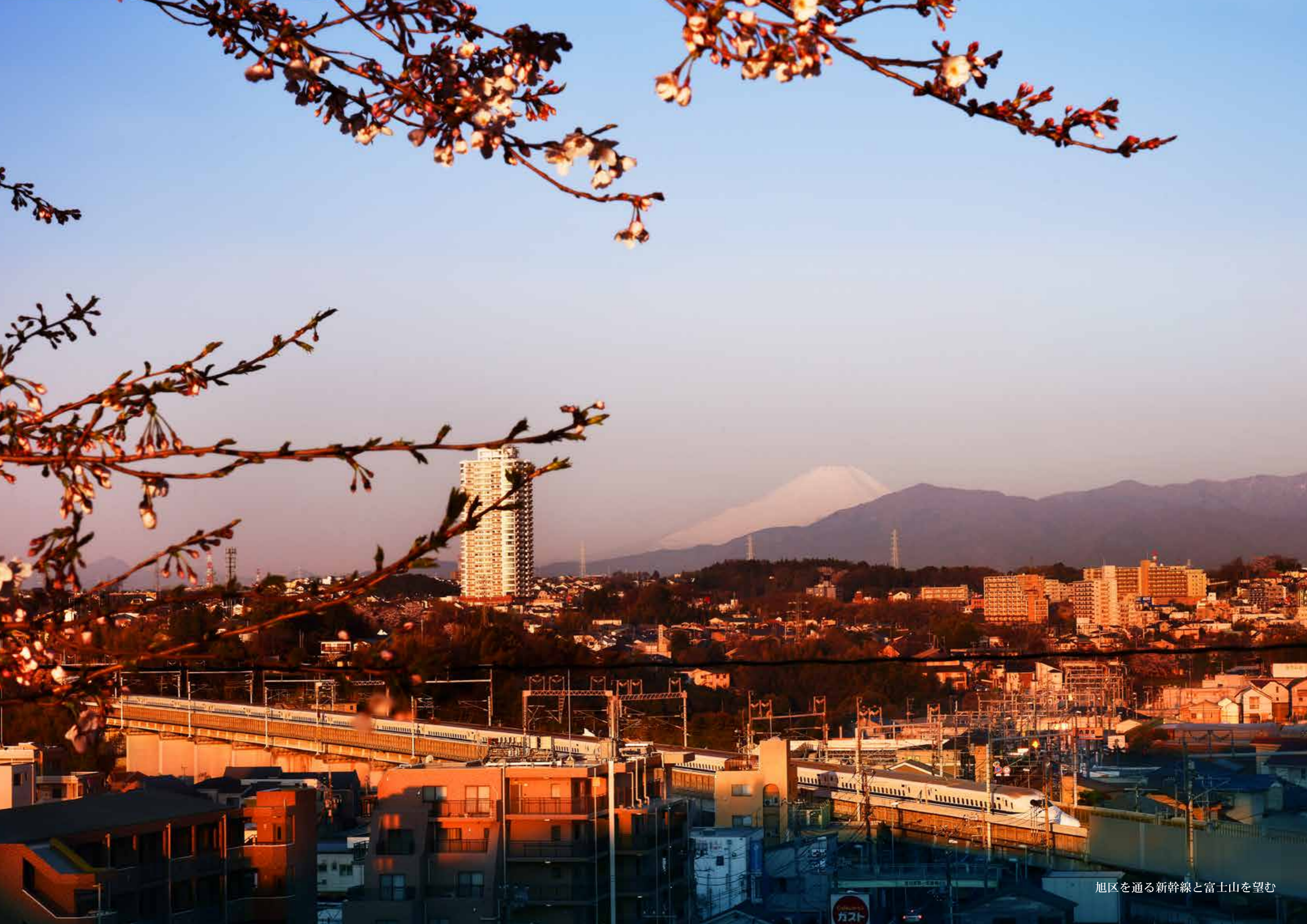
旭区を通る新幹線と富士山を望む