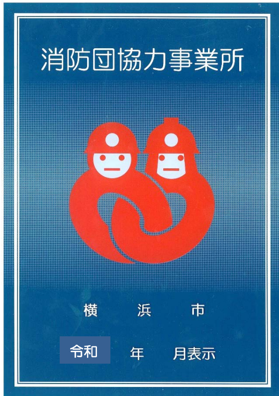
「消防団協力事業所表示制度」 表示証イメージ

「横浜市消防団協力事業所表示制度」とは、横浜市長が認定する消防団活動に積極的にご協力いただいている事業所や団体に対して、地域における事業所の社会貢献を広く認められるよう表示証を交付するものです。