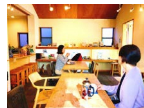
港北区 NPO 法人街カフェ大倉山ミエル