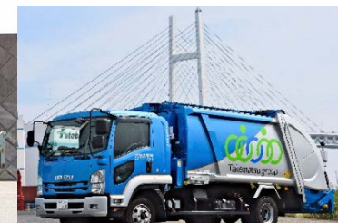
新装デザイン(産廃車両)