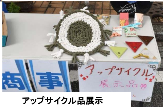
アップサイクル品展示