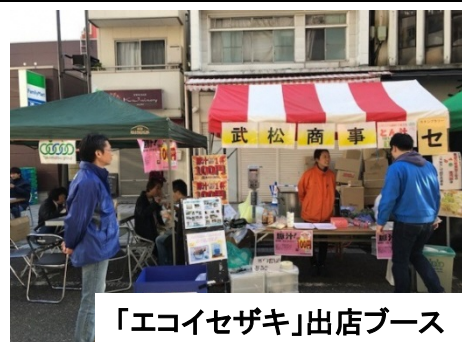
「エコイセザキ」出店ブース