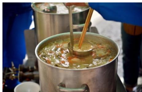
特性“豚汁”(自社豚舎育成)