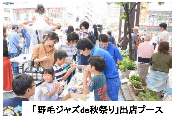
「野毛ジャズde秋祭り」出店ブース