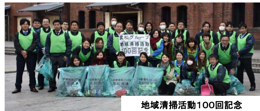
地域清掃活動100回記念