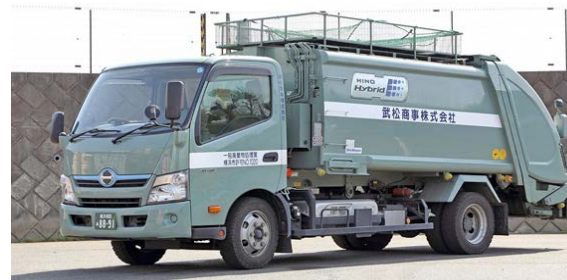
環境に配慮したハイブリッド車(一廃車両)