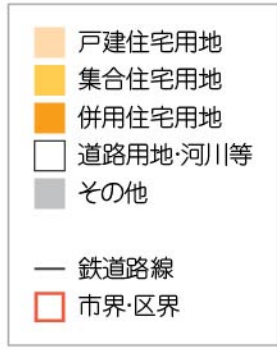
■区別住宅系土地利用面積(ha)

*グラフの数値は上から、戸建住宅用地、集合住宅用地、併用住宅用地 の面積を示しています。