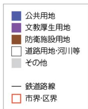
■ 区別その他の建築用地面積 (ha)

* グラフの数値は上から、公共用地、文教厚生用地、防衛施設用地 の面積を示しています。