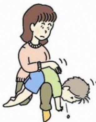
図 2 背部叩打法変法 (少し大きい子)