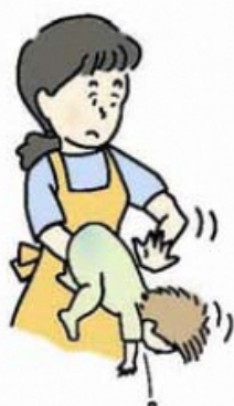
図 1 背部叩打法 (乳児)

乳幼児では、口の中に指を入れずに、乳児は片腕にうつ伏せに乗せ顔を支えて (図 1)、また、少し大きい子は立て膝で太ももがうつ伏せにした子のみぞおちを圧迫するようにして (図 2)、どちらも頭を低くして、背中の中を平手で何度も連続して叩きます。なお、腹部臓器を傷付けないよう力を加減します。