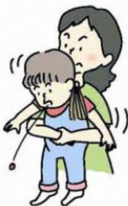
図 3 ハイムリッヒ法 (年長児)

大人や年長児では、後ろから両腕を回し、みぞおちの下で片方の手を握り拳にして、腹部を上方へ圧迫します (図 3)。この方法が行えない場合、横向きに寝かせて、または、座って前かがみにして背部叩打法を試みます。