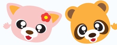
横浜市交通安全マスコットキャラクター ルールちゃん まるくん