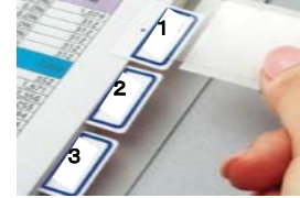
【インデックスのイメージ】