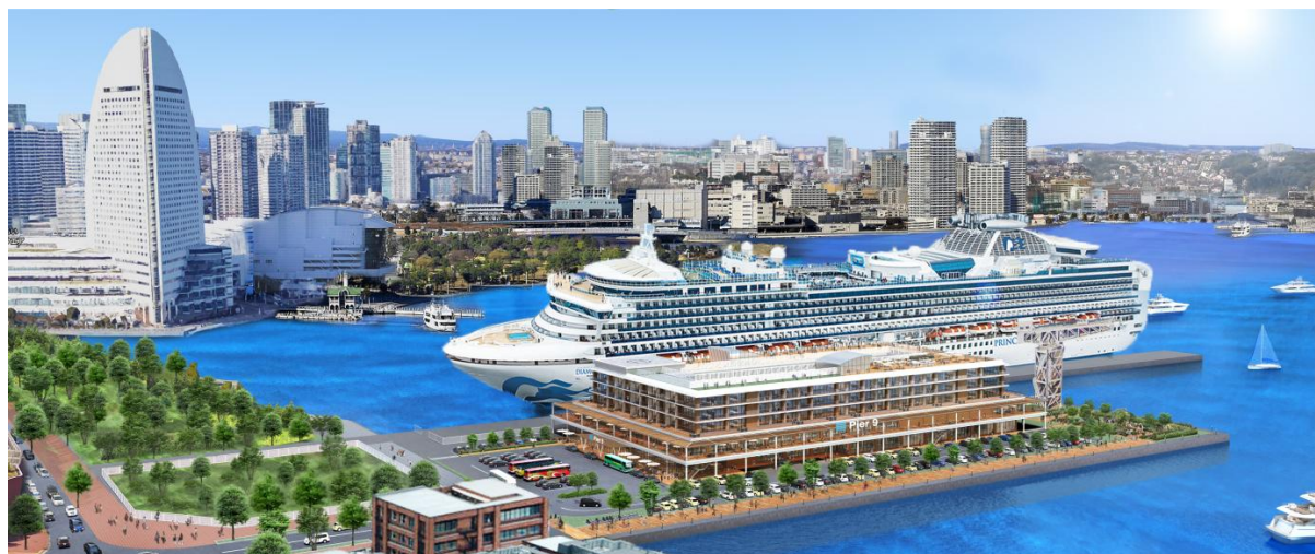
完成予想パース（現在計画中の為、今後変更になる可能性があります。）

本事業は、横浜市と民間事業者が公民連携して客船ターミナル施設(以下、CIQ施設※1)を中核とした複合開発を行うものです。当グループは、「食」をテーマとした体験・体感型の商業施設や、埠頭という希少な立地特性を活かした高質ホテルを、CIQ施設と一体的に整備します。これにより近年急増しているクルーズ船客のニーズに応えるとともに、横浜市民の皆様、そして国内外からの多くの観光客が集い、賑わう新たなクルーズ拠点の形成を目指してまいります。またさらに、横浜都心臨海部の各エリアと緊密に連携を行うことで広域的な活性化を図り、横浜の国際観光都市としての更なる発展に貢献してまいります。