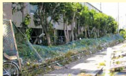
施設を囲むフェンスが倒れている様子

横浜市内では特に金沢区の臨海部の被害が大きく、台風接近による高潮や強風、4mを超える高波が発生し、護岸の破損や、400を超える事業者にも車両や機械設備の水没、破損等の被害が生じました。