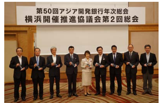
第 2 回総会の様子