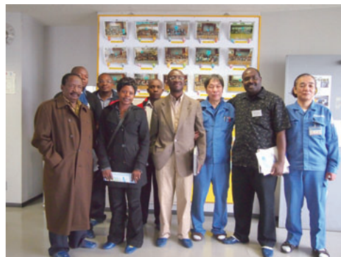
鶴見工場視察 Visit to Tsurumi Incineration Plant