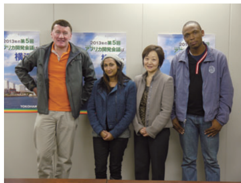
魅力づくり室長との面会 Meeting with Director of City Brand Promotion Office