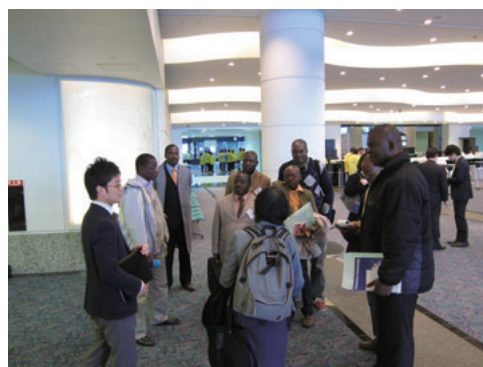
パシフィコ横浜視察 Visit to Pacifico Yokohama