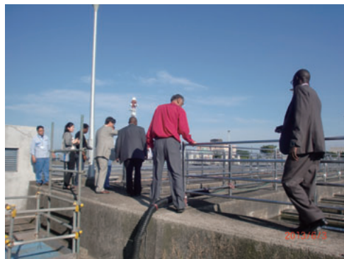
西谷浄水場視察 Visit to Nishiya purification plant