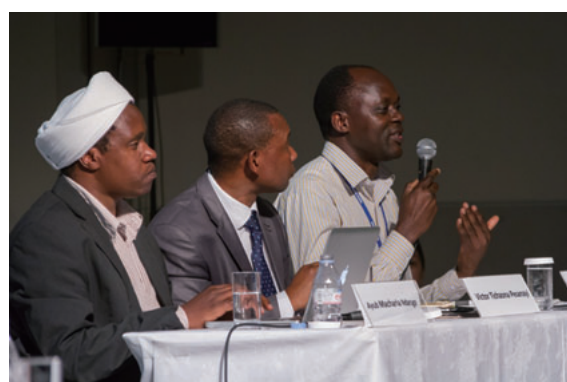
UNU-IAS 公式サイドイベント TICAD V official side event (UNU-IAS)

共催：国際連合教育科学文化機関 (UNESCO)、国際連合児童基金 (UNICEF)、ESD に関する地域の拠点 (RCEs)