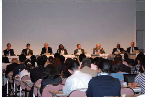
FAO 公式サイドイベント TICAD V official side event (FAO)

共催：国際農業開発基金 (IFAD)、国連貿易開発会議 (UNCTAD)、世界銀行