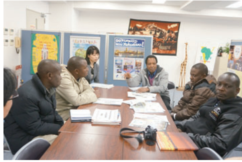
市職員との意見交換 Meeting with the city officials