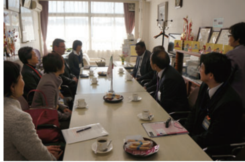
学校訪問 Visit to elementary school