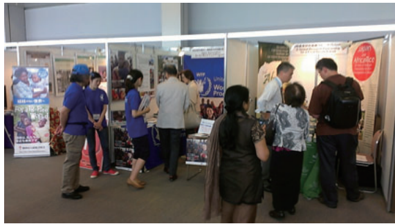
国連 WFP ブース出展 Booth exhibition (WFP)