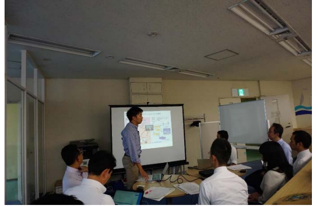
<グループディスカッション>