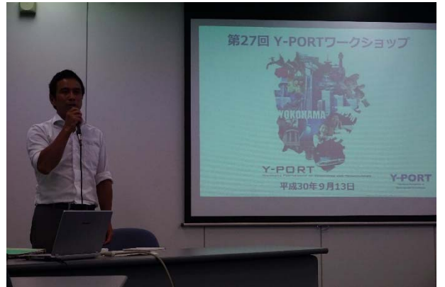
<グループディスカッションでの議論内容発表>