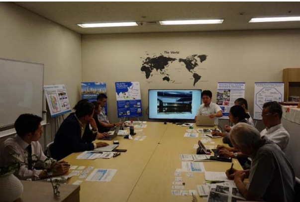
<グループディスカッション>