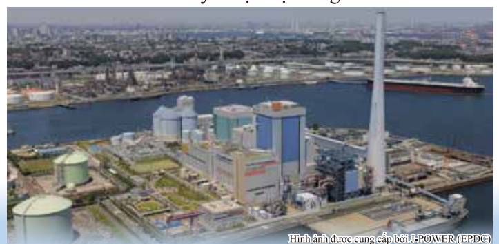
Nhà máy nhiệt điện Isogo

“Thỏa thuận phòng, chống ô nhiễm” đã có sự thay đổi về nội dung, dẫn tới những điều chỉnh về nội dung trong “Thỏa thuận bảo vệ môi trường”, bao hàm những tác động môi trường mới phát sinh có hại đối với con người, những vấn đề môi trường đô thị và toàn cầu, vấn đề bảo tồn sinh thái, bảo tồn đa dạng sinh học và cải tạo cảnh quan, v.v.