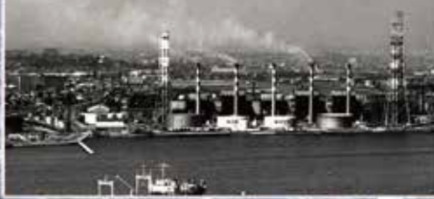
Nhà máy nhiệt điện Yokohama (trước)