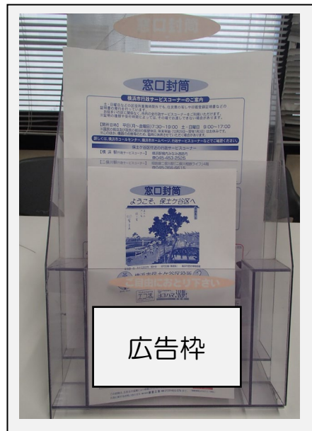
▼表紙画像：前回 (令和5年1月) 発行分