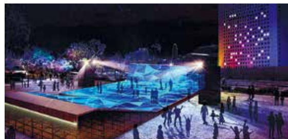
▲デジタルコンテンツイメージ(新港中央広場)

今、横浜の新港地区とその周辺では、「ナイト シンク ヨコハマ」という、ナイトアートプログラムを開催していて、私はそのクリエイティブ・ディレクターを務めています。美しい横浜のイルミネーションに先端技術を活用した光、それに来場者の皆さまにもシンクロ(同調)していただき、今までにない新しい横浜の夜景を生み出せればと思っています。見るだけではなく、皆で参加し一緒に作り上げる、そんな新しい横浜の夜景の魅力をぜひ体感してみてください。