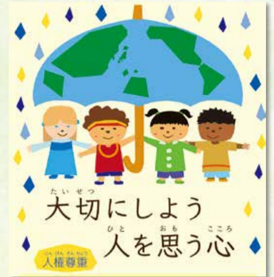
令和元年度人権啓発ポスター デザイン:横浜デジタルアート専門学校 蝦名 竜太郎さん

法務省が毎年度実施する「全国中学生人権作文コンテスト」の横浜市大会に、今年度は55,000作品を超える人権作文の応募がありました。その中から、「横浜市長賞」を受賞した作品を紹介します。