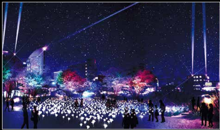
▲イルミネーションイメージ(新港中央広場)