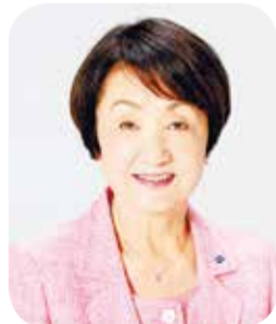
横浜市長 林 文子

また、日本中を感動と興奮で包み込んだラグビーワールドカップ2019™日本大会をはじめ、ガーデンネックレス横浜、横浜音祭り2019には、皆様の温かなおもてなしの中、国内外から多くのお客様をお迎えし、街は大いに賑わいました。