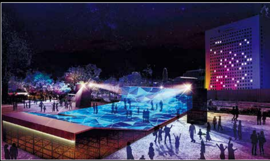
▲デジタルコンテンツイメージ(新港中央広場)