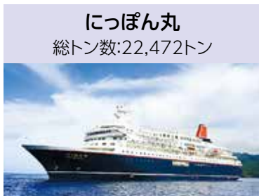
にっぽん丸 総トン数:22,472トン