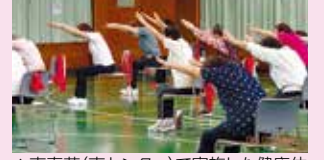
▲南寿荘(南センター)で実施した健康体操の様子