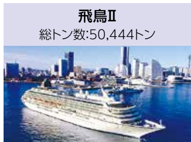
飛鳥Ⅱ 総トン数:50,444トン