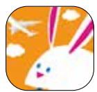
▲「カタログポケット」のアプリアイコン

カタログポケットは、広報紙をパソコンやスマートフォンアプリで閲覧できる無料サービスです。多言語への自動翻訳機能や、音声読み上げ機能、文章を読みやすくするポップアップ機能などがあります。 ぜひカタログポケットで「広報よこはま市版」と検索してください。 ※「広報よこはま」は毎月1日に更新予定です。