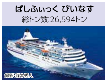
ぱしふいっく びいなす 総トン数:26,594トン