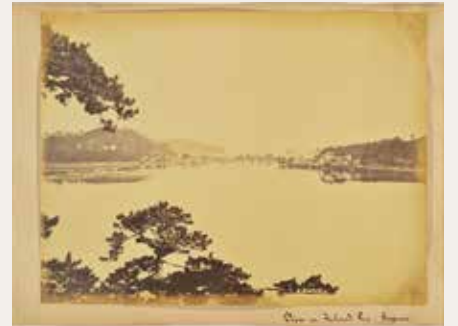
▲金沢八景の九鯉亭から野島(左奥)を望む

長崎といった日本各地の風景が鮮明に記録されていたのです。横浜の山手から撮った写真には、日本人大工が建てた「半欧米風」の街並みがひろがっています。一方、金沢八景を写した写真には、海と岬が織りなす美しい光景が鮮やかに焼き付けられていました。