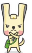
「ヨコハマ3R夢」 マスコットイーオ

無許可の業者へ依頼すると、高額な料金請求や不法 投棄など、さまざまなトラブルに巻き込まれる恐れが あります。