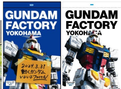
↑掲出フラッグ・横断幕イメージ