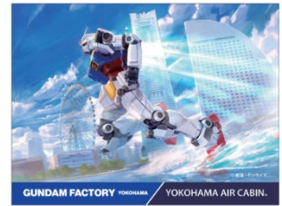
↑ステッカーイメージ