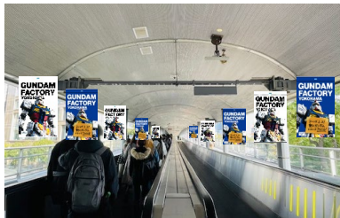
↑フラッグ掲出イメージ