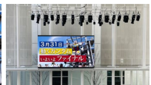
◎創造・サンライズ