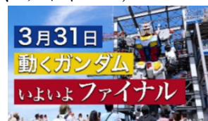
映像放映イメージ→