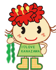
金沢区幸せお届け大使 ぼたんちゃん

イベントでは、わかめの生育の様子や海洋生物が温室効果ガスを吸収することなどについて学び、“海育”を体験することができます！また、当日はサッカーJリーグクラブの横浜FCにもご協力いただき、当イベントを実施します！特別ゲストも登場予定ですので楽しみに！！