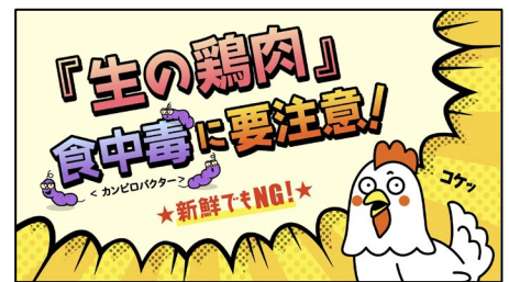
啓発広告イメージ