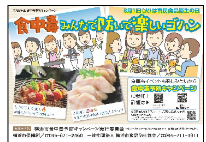
令和5年度啓発ポスター

(URL) https://www.city.yokohama.lg.jp/kurashi/kenko-iryu/shoku/yokohamaWEB/gyomu/eisei/tyuudoku-ibento/shoku-campaign.html