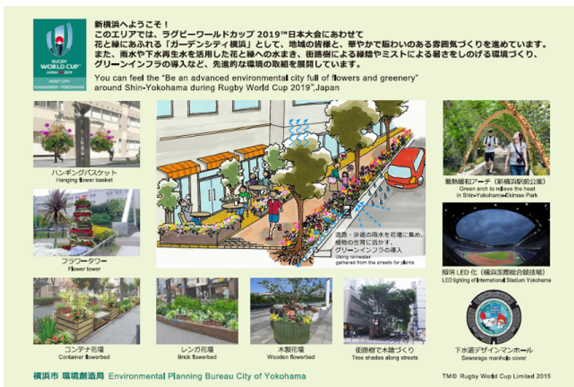
案内プレート イメージ

これらの取組内容をお知らせする案内プレートを、8月29日に設置しました。エリア内に6箇所設置し、国内外からの来街者に取組を発信しています。