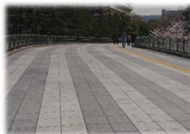
(横浜国際総合競技場 東ゲート橋)