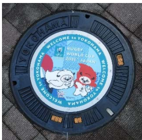
デザインマンホール