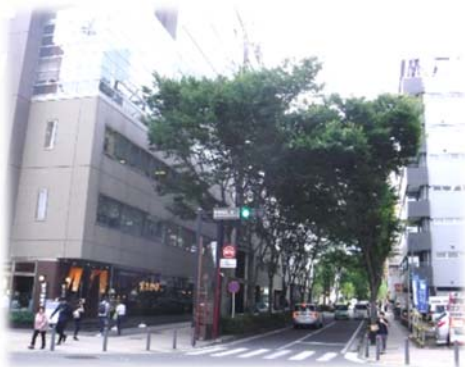
(Fマリノス通り、アリーナ通り)