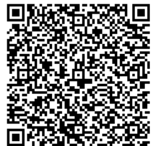
(申請フォーム二次元コード)