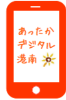
「あったかデジタル港南」 ロゴマーク

デジタルの力で区民の皆さまの利便性向上や区役所業務の効率化を進めることで、区民の皆さまと向き合う時間を増やし、これまで以上に「あったかい区役所」を実現します。