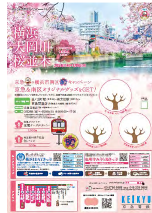
▲スタンプ台紙付きチラシ