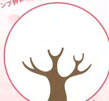
京急百貨店 スタンプ押印欄