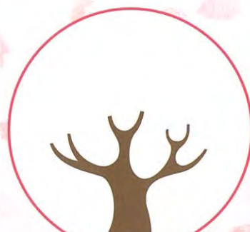
日ノ出町駅 スタンプ押印欄