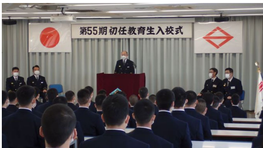
令和5年度 入校式の様子

取材を希望される場合は、当日直接受付にお越しくください。お車での来場も可能です。 当日は、新採用職員へのインタビューも可能です。