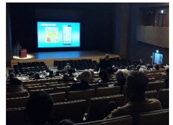
事例発表会イメージ