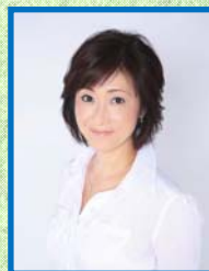
岩崎 里衣 フリーアナウンサー