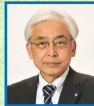
鈴木隆 横浜市副市長