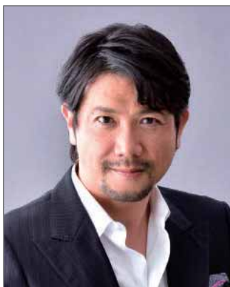
別所 哲也 さん