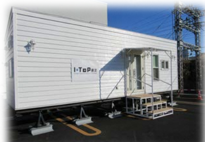
実験実証を行う IoT スマートホーム

横浜市旭区さちが丘 47-1（地図裏面） （そうてつローゼンミニ さちが丘店敷地内 二俣川駅北口より徒歩 7 分）