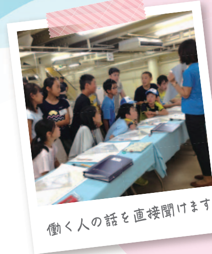
働く人の話を直接聞けます