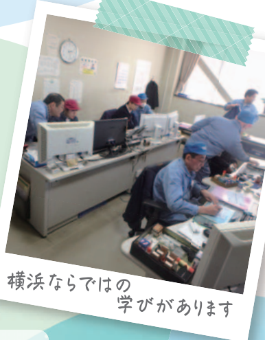
横浜ならではの 学びがあります

水圧・浮力 (中1理科) エネルギー資源 (中3理科) 地震 (中1理科) 日本の地域構成 (中学地理)