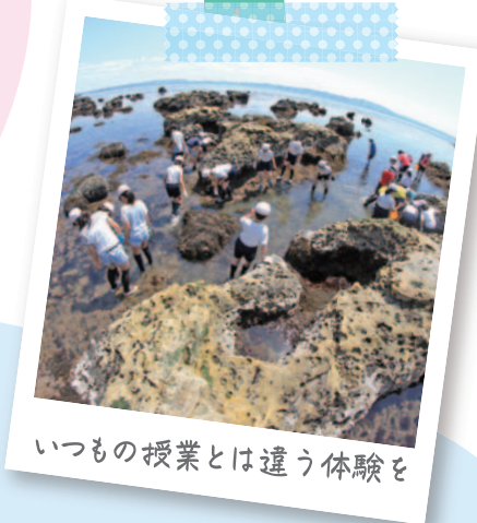
いつもの授業とは違う体験を