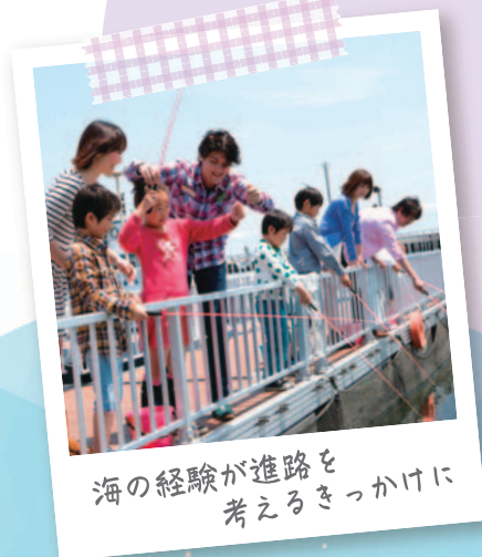
海の経験が進路を 考えるきっかけに