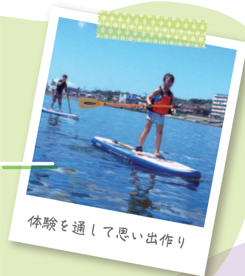
体験を通して思い出作り