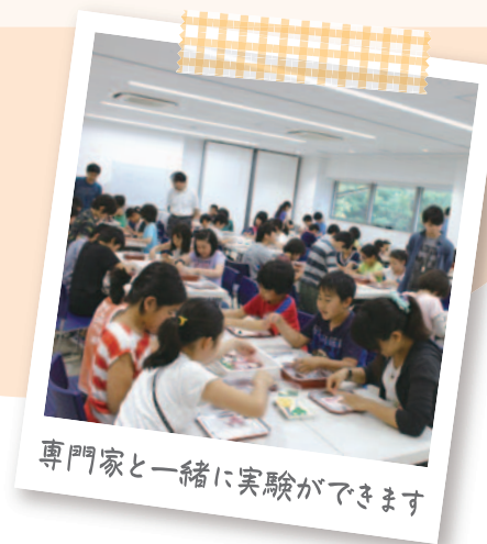
専門家と一緒に実験ができます

生物と環境 (小6理科) 大気と海洋 (中2理科) 自然環境の保全 (中3理科)