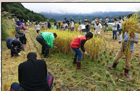
横浜市民と昭和村民の交流のようす