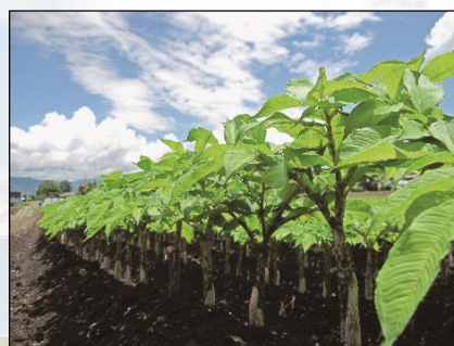
こんにゃく芋の生産量日本一！