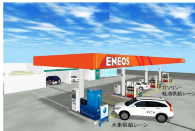
ガソリンスタンド一体型水素ステーション（海老名中央水素ステーションのイメージ）