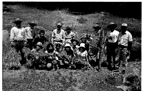
写真-3 小学生を迎えての麦刈り(荒井沢緑栄塾、栄区内)

(注) 本稿の第4節は、市民・NPOを含む執筆者4名の討論を、協働の理念になじむKJ法の手法により整理しまとめた。