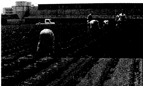
写真-2 「はま農楽」による農家への援農活動（泉区内）