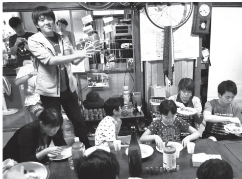
カサコワークショップの様子