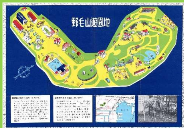
野毛山遊園地のパンフレット