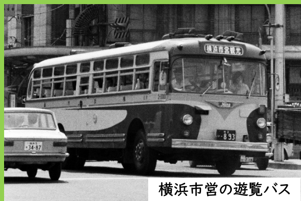
横浜市営の遊覧バス

かつて横浜市営バスでは、市内を遊覧する貸切り式の定期観光バスが走っていました。そして、昭和の時代、そのルートには、横浜市中心図書館の所在する野毛山が含まれていました。当時、野毛山は行楽と眺望を備えた人気の観光スポットでした。この展示では、図書館の開館30周年にあわせて、遊覧バスと野毛山に関する資料を紹介します。(観覧無料)