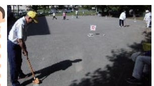
グラウンドゴルフ