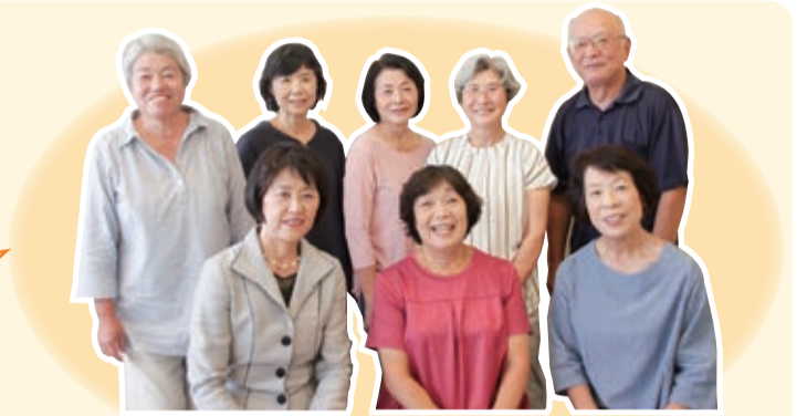
「仏向おしゃべりサロン」で子育てを応援している皆さん

ちょっとした声掛けや気遣いが子育て中の人の気持ちを軽くしたり、ほっとさせたりします。みんなで子育てを応援する、あたたかい地域を広げていきましょう。