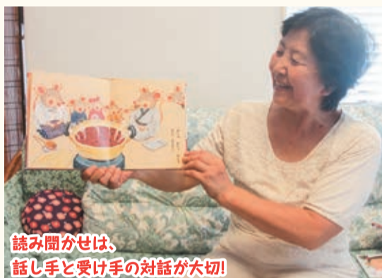
読み聞かせは、話し手と受け手の対話が大切!