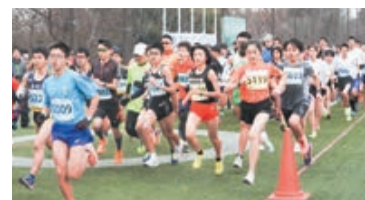
▲昨年は1,314人のランナーが参加!

自然あふれる公園内を楽しみながら走ってみませんか。走力にあわせて参加できるマラソン大会ですので、家族や友達と一緒にぜひご参加ください。