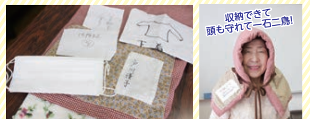
▲着替え入り防災頭巾

「防災はエンドレス。学んで終わりではない。学んだことを1人でも多くの方が発信し、災害時にそれを実践できることが最も大切なこと。かながわ女性防災の会員もぜひ増やしていきたい。」と今後の展望を熱く語ってくれました。