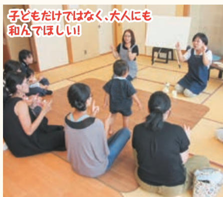
子どもだけではなく、大人にも和んでほしい!