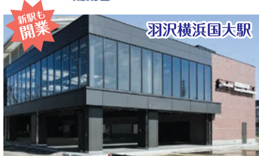
新駅も開業 羽沢横浜国大駅