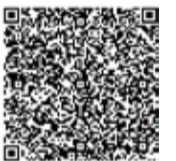
▲読み取るとEメールが送れます

自治会町内会では、自分たちのまちを安全・安心で住みやすくするため、道路・ごみ集積場所・公園などの清掃や、パトロール、防災活動など生活に密着した活動をしています。また、地域の親睦を深めるため、夏祭りや運動会を開催しています。住みやすいまちづくりには、そこに住む皆さんの協力が不可欠です。ぜひ自治会町内会に加入し、活動に参加しましょう。加入・活動内容については、近くの自治会町内会役員に問合せるか、事務局までEメールをお送りください。