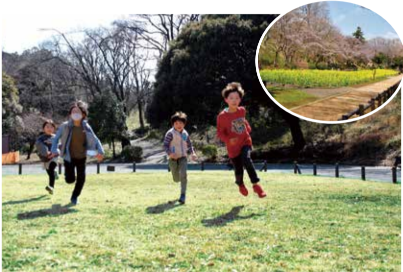
広い芝生で子どもも大人も走り回れます♪