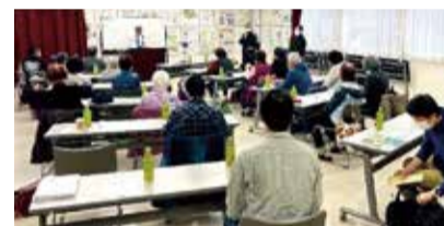
講習会の様子(令和3年度)

普段から、家族や近所の人と 災害に備えて話し合っておくことが 必要だと感じました。