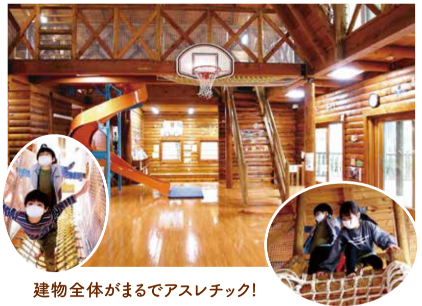
建物全体がまるでアスレチック!