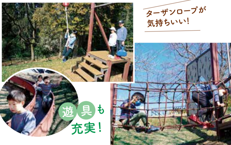
ターザンロープが気持ちいい!