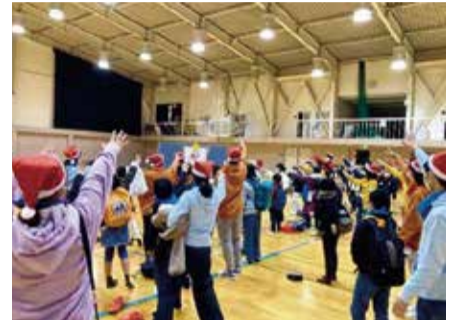
大学でのレクリエーション 「さよならじゃんけん」