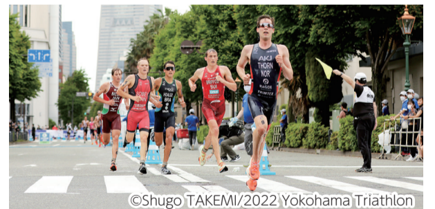
2022 Yokohama Triathlon ワールドトライアスロンシリーズ横浜大会