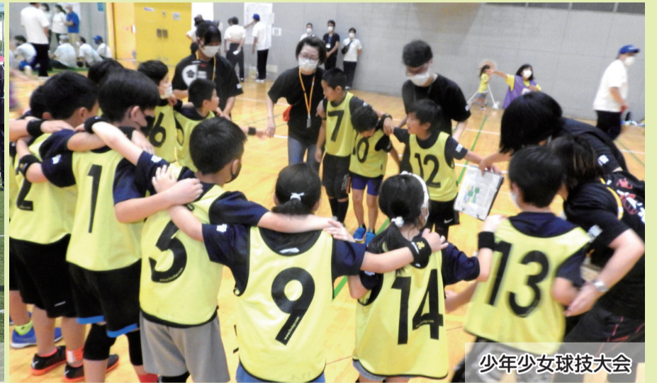
少年少女球技大会