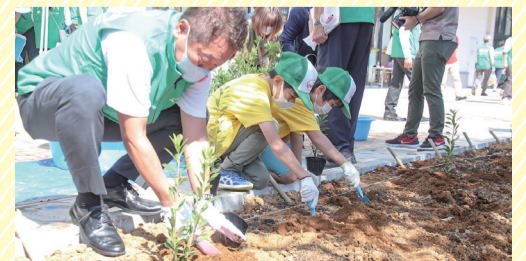
植樹祭では、子どもたちと区の木シノキなどを植えました!

新店舗を運営していくにあたり大切にしたいのは、これまで培ってきた地域・商店街とのつながりをしっかり受け継いでいくこと。「さまざまなイベントに参加したり、デジタルサイネージで行政や商店街の情報を発信したりするなど、一緒に地域を盛り上げていきたいです。また、「イオンがあって良かった」と思ってもらえるよう、従業員一丸となり頑張っていきます」と今後の思いを力強く語ってくれました。