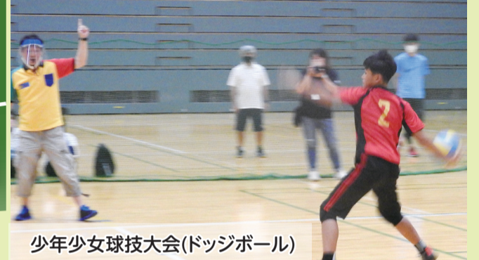
少年少女球技大会(ドッジボール)