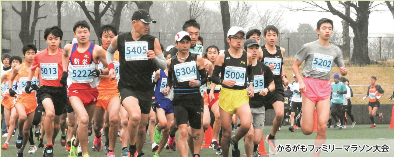
かるがもファミリーマラソン大会