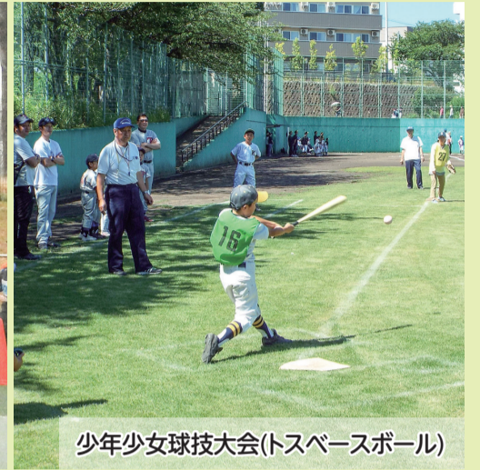
少年少女球技大会(トスペースボール)