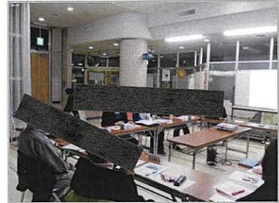
保土ヶ谷スポーツセンターをもっと良くする利用者会議

いただいたご意見や改善策を館内掲示やホームページに掲載し、会議の内容を公開することで、保土ヶ谷スポーツセンターの改善活動をお示しします。