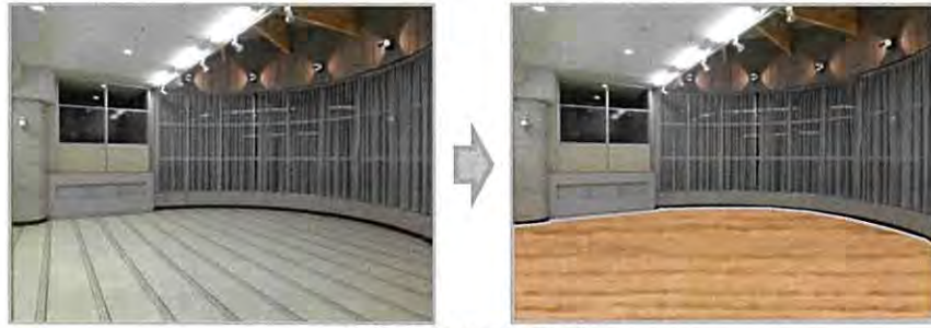
運動にも適したフローリングへ