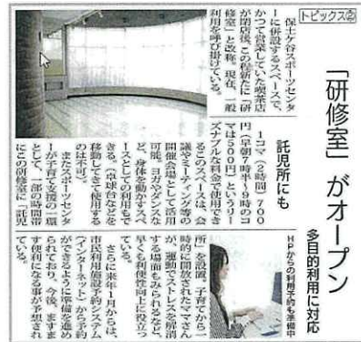
研修室のオープンに伴いタウン誌に掲載

他の諸室と同様、研修室の利用については、「横浜市民利用予約システム」での運用が求められています。前述の利用種目統計データからもダンスや体操・太極拳・空手などの種目利用が多いことから、さらに多くの団体に利用していただけるように、タウン誌やチラシの配架等の広報を充実させ、周知を徹底します。また、利用者からのニーズを反映し、鏡やスクリーンなどの設備の充実を図ります。