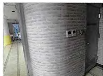
研修室の奥にある電源スイッチを使いやすく

現在、空調と照明のスイッチは、研修室の奥にあり、ご利用されるお客様に不便さを感じさせています。また、保土ヶ谷区体育協会の事務所が隣接しており、保土ヶ谷区体育協会の空調、照明のスイッチも同箇所にあるため、事務作業を行う際には、研修室をお客様が利用している中を通らなければいけません。