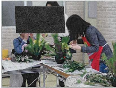
季節感あふれるフラワーアレンジメント教室