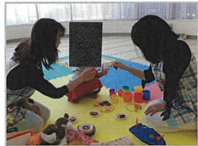
子育て世代を支援する託児サービス

子育て世代の方が、心おきなく身体を動かし、リフレッシュしていただけるように、保土ヶ谷区の事業等で実績のある保育ボランティアと連携して、「託児サービス」を実施します。しかし、研修室は優先利用枠の制限もあるため、全コマを託児事業として使用することはできません。そこで、保土ヶ谷地域子育て支援拠点「こっころ」等で活動している子育てサークルに情報を提供し、積極的な研修室利用活動を支援します。