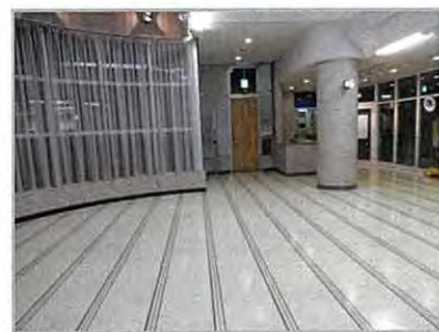
平成 25 年 8 月よりスタートした研修室

その後、保土ヶ谷区役所地域振興課と当体育協会が協議を重ね、保土ヶ谷スポーツセンター指定管理業務の一部として基本協定を変更し、平成 25 年 8 月 1 日より研修室として稼働しています。