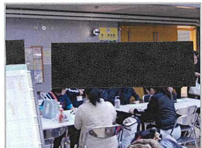
日本体育大学学生の協力による利用者アンケート調査

実施にあたっては、公共スポーツ施設の運営知識を有し、お客様からのご意見聴取やその分析、ヒアリング等を通じて、学術的な面での的確なアドバイスができる機関を厳選し、当体育協会の負担により行うこととします。