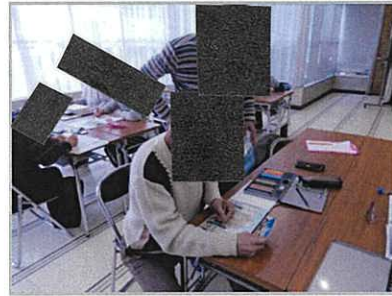
抽選が行われるほどの人気教室 「色鉛筆画教室」