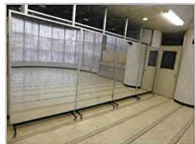
鏡を設置(イメージ)

研修室は前述の利用団体統計データからもわかるように、ダンスやエアロビクスを行うお客様が多く占めています。また、ご利用されるお客様から鏡の設置を要望するご意見もいただいています。これまで活動中に鏡を必要とするお客様には、スポーツスタジオ(2階)のご利用を促していましたが、スポーツスタジオ以外でも鏡を使った活動や教室が開催できるように鏡を設置し、稼働率の向上を図ります。