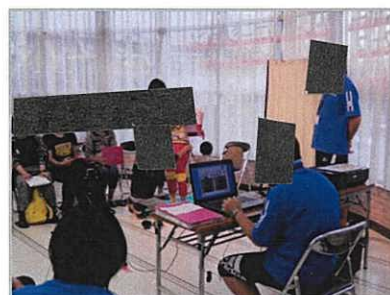
スポーツ・レクリエーションフェスティバルで実施した姿勢測定会

毎年開催されるスポーツ・レクリエーションフェスティバルや保土ヶ谷区体育協会共催事業「ほどがやスポーツ祭り」、2020年オリンピック・パラリンピック東京大会関連事業等、時期に合わせたイベントを開催します。