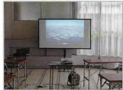
スクリーンを設置(イメージ)

映像を映すためのプロジェクターは新規購入し、レンタル物品（有料）にて貸し出しを行います。