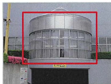
ガラス面含む壁面を企業広告掲出場所として活用