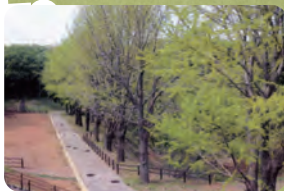
いちよう並木と草地広場