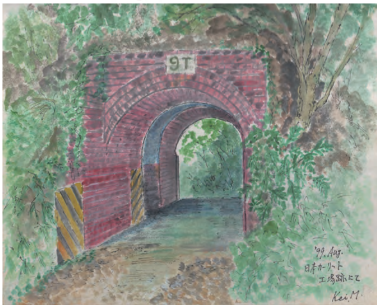
日本カーリット工場時代の土塁の入口

戦 後も平和産業用の火薬の製造が続けられましたが、平成7年に群馬県に工場移転が決まりました。その跡地の一部を近代産業の遺構の記念として残し、横浜市の「たちばなの丘公園」（この地域は昔、武蔵国橋樹郡であったところから）として整備され、保土ケ谷区側が開園されました。今後は、旭区の市沢町側を整備して、今の倍以上の広さの公園になります。お楽しみに！