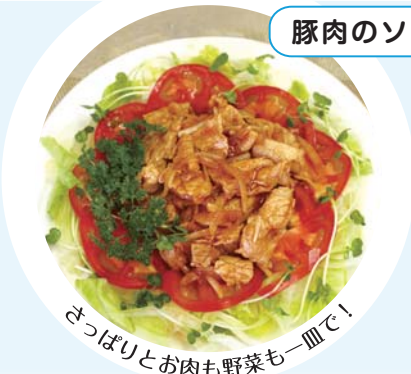
さっぱりとお肉も野菜も一皿で!