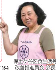
保土ヶ谷区食生活等改善推進員 会長

「私たちの健康は私たちの手で」をスローガンに、地域で食を中心とした健康づくりの実践および普及・啓発を推進している全国組織のボランティア団体です。 保土ヶ谷区のヘルスマイトは、平成27年度に結成50周年を迎え、現在は103人が活動しています。