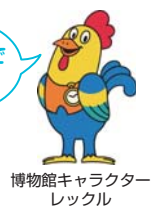
博物館キャラクター レックル