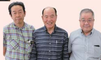
男性会員も活躍中!

男性ならではの役割もあり、一緒に活動している皆さんが尊重してくれます。男性会員は少ないですが、充実したヘルスマイト活動を送っています。