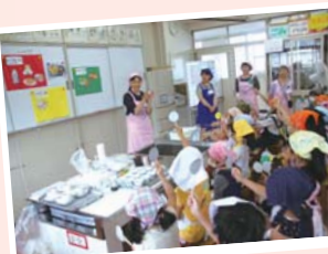
小学校での食育活動

さらに、ヘルスマイトとしてのスキルアップのため、栄養や健康に関する活動に役立つ知識の習得を目指し、定例会を月に1回開催しています。