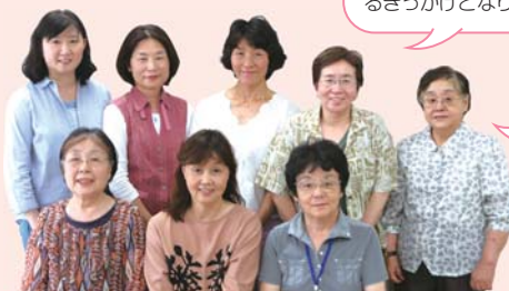
会員2年目のヘルスマイトの皆さん

軽い気持ちでセミナーに参加しましたが、健康には「食」が大切だと痛感するきっかけとなりました。