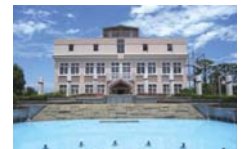
▲横浜水道記念館正面

【所在地】川島町522 【アクセス】相鉄線「上皇川」駅徒歩約15分、相鉄線「和田町」駅下車 相鉄バス約5分「浄水場前」バス下車 ※駐車場はありません。公共の交通機関をご利用ください。