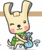
「ヨコハマ3R夢」マスコットイーオ