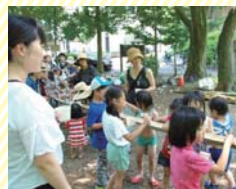
普段できない遊びに夢中

ほどがやわくわくプレイパーク 開催日時:10月、2月を除く第2日曜 10時30分～15時30分 会場:県立保土ヶ谷公園わんぱく広場