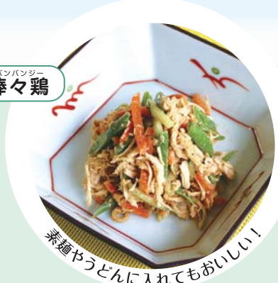
菜類やうどんに入れてもおいしい!